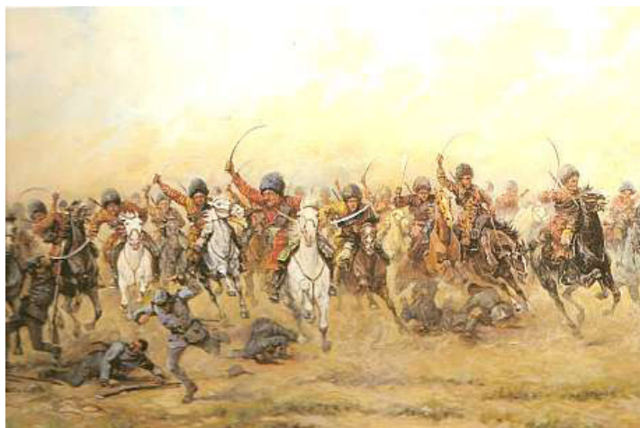
Атака «Дикой дивизии»

«дикие» горцы казались еще дисциплинированнее, чем до революции».