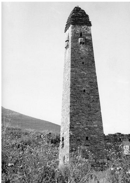
Боевая башня Хайбах (1989 г.)

циальными властями, и ему не давалась соответствующая оценка. И вот почему об этой трагедии одним из первых начал писать Кашурко.