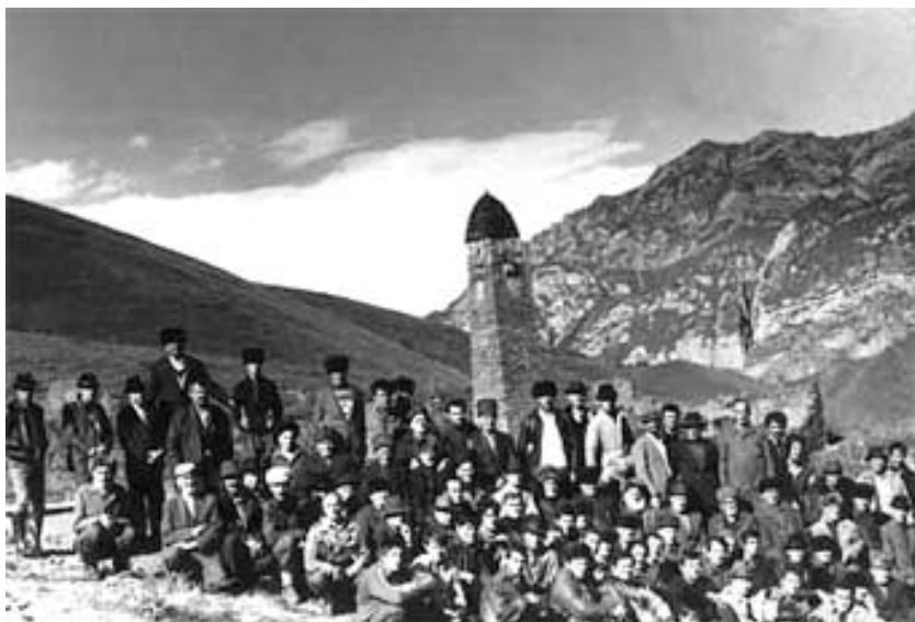
Хайбах (1989 г.)