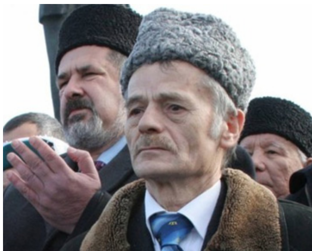
Мустафа Джамилев – лидер крымских татар

«Считая земледельческий труд уделом рабов, крымские татары предпочитали добывать пропитание разбойными набегами на