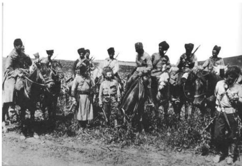
Конница «Дикой дивизии»