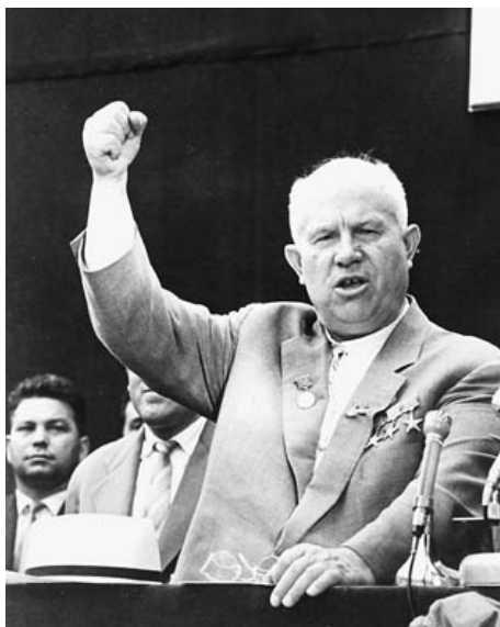
Н. С. Хрущев

настроения к рабочему классу и крестьянству – дворяне и, разумеется, гнилая интеллигенция, городские богачи-ремесленники и купцы, деревенские богатеи-кулаки и с ними середняки, всякие прочие, не подходящие новому миру сословия». Около 50 миллионов человек в Советском Союзе было так или иначе затронуто репрессиями. От 10 до 15 миллионов человек, как «враги на-