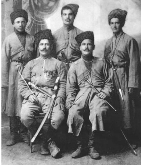
Ветераны «Дикой дивизии»

Пыхалов приводит сводку бытовых преступлений, якобы совершенных чеченцами против казаков, которые, по его мнению, должны подтвердить их агрессивный, преступный образ жизни. Единственным «доказательством»