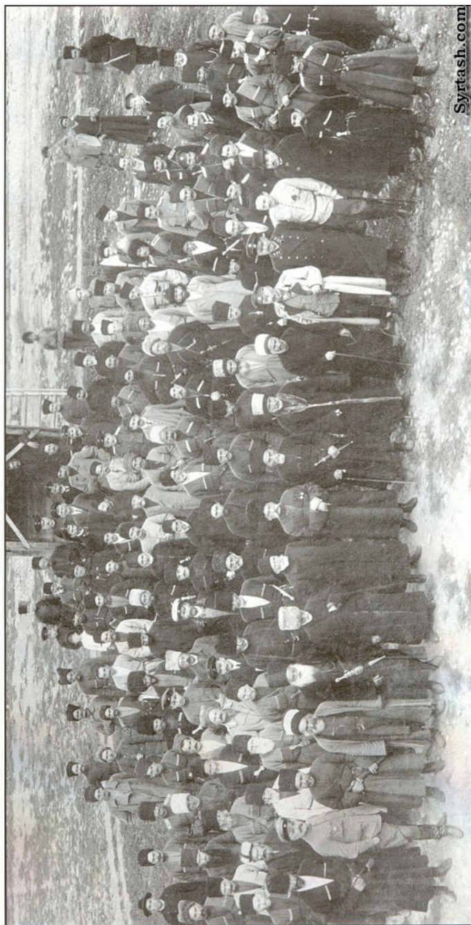
Съезд горских народов. 20-е годы XX века